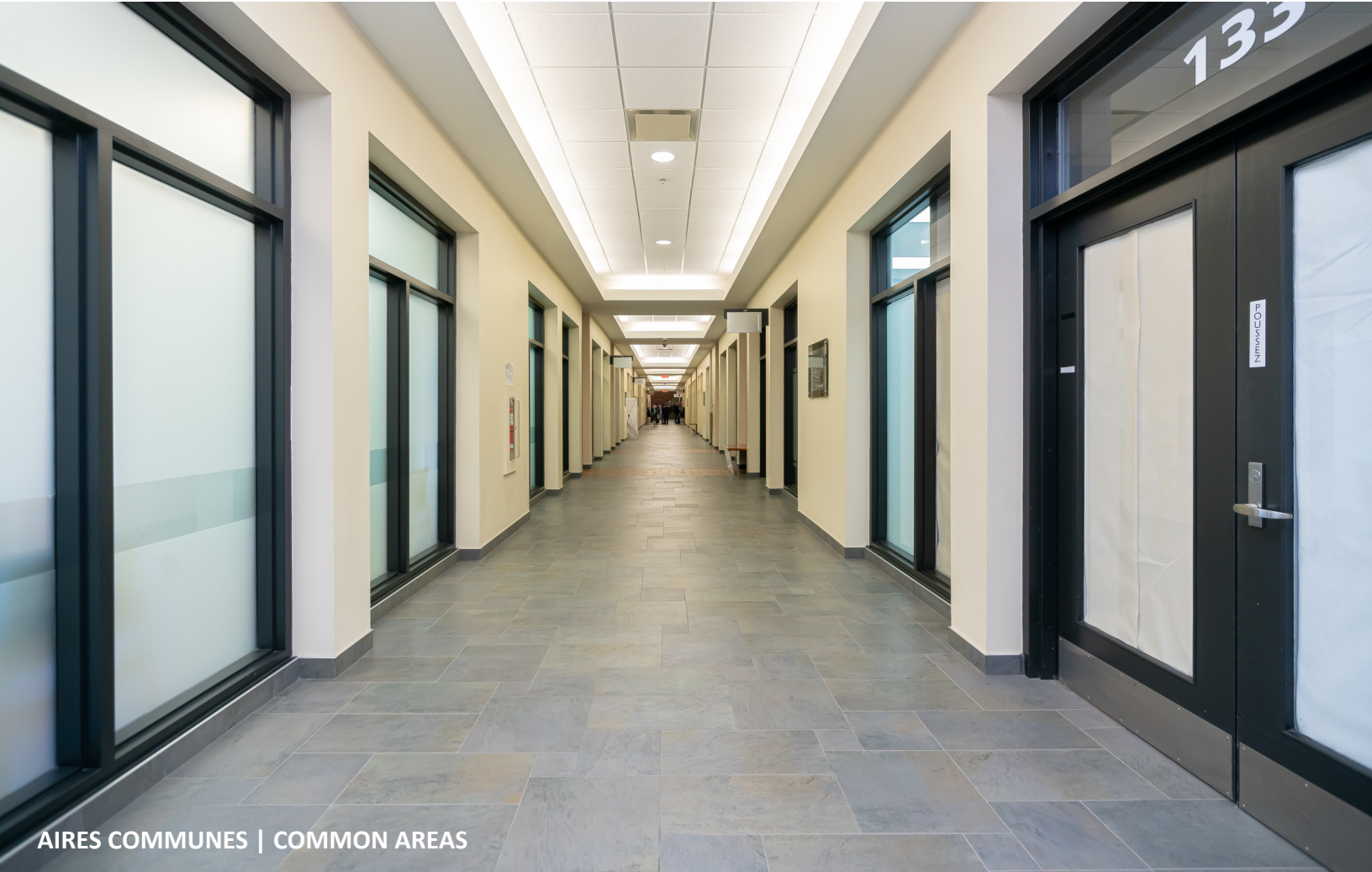
AIRES COMMUNES | COMMON AREAS